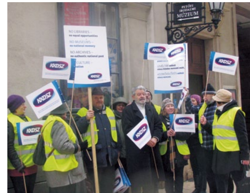
A KKDSz tüntetése a belvárosban